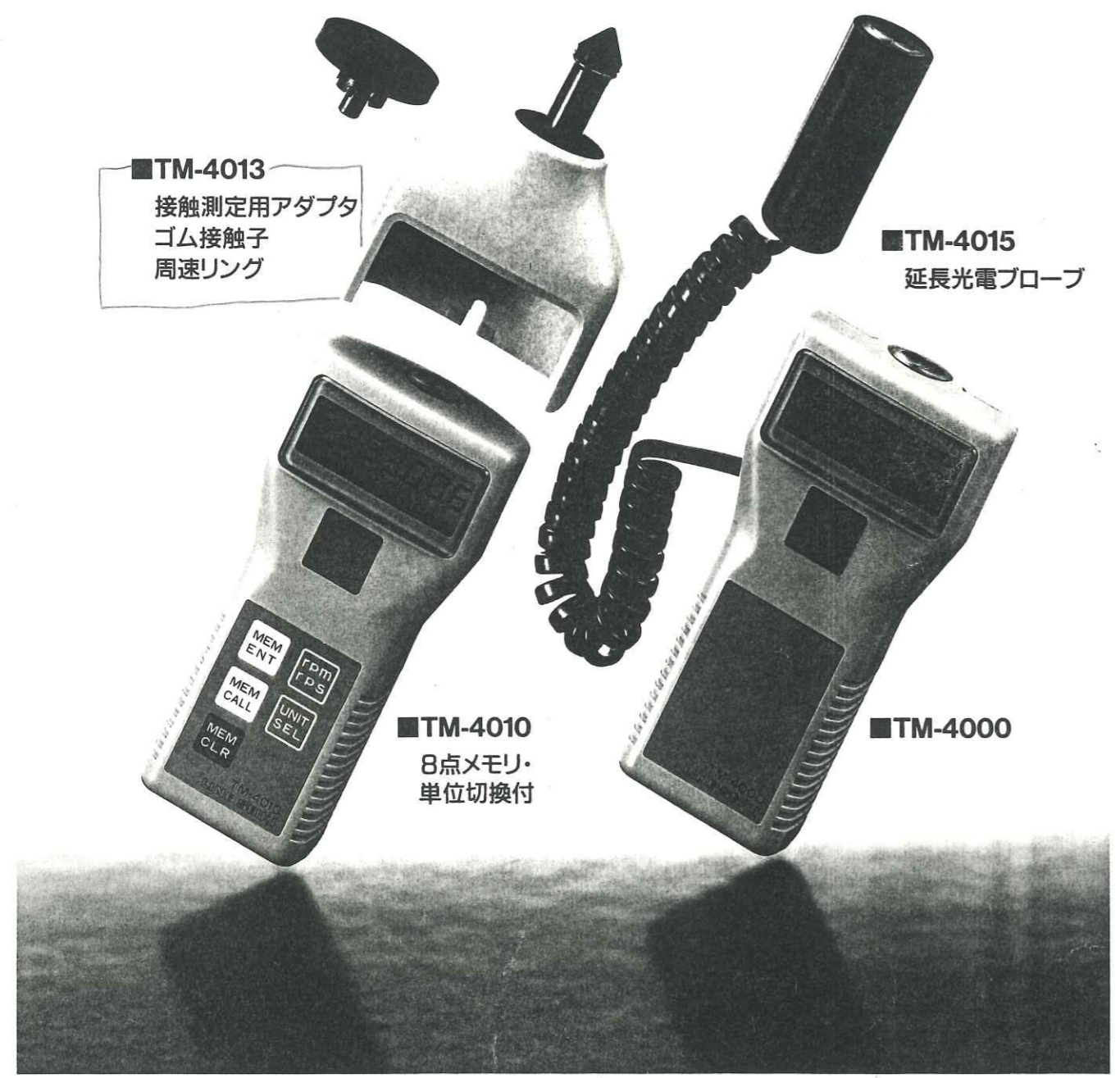
■TM-4013 接触測定用アダプタ ゴム接触子 周速リング

アダプタ方式により接触/非接触の測定が可能・延長光電プローブの使用により狭い場所の測定が可能