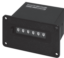
MCR - 4PN・5PN・6PN