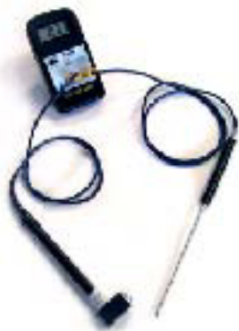
2つのプローブを同時に接続できます 切替もワンタッチで簡単にできます